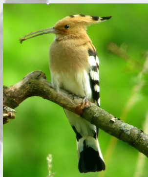
Huppe fasciée

Sur réservation auprès de Dominique Landragin : 06.83.29.25.47/ meuse@lpo.fr