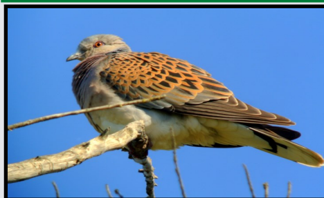
Tourterelle des bois-JP Lang

Pensez à vous équiper de chaussures de marche adaptées aux chemins boueux... Prévoyez également une tenue de pluie ou une tenue adaptée aux conditions météorologiques du jour.